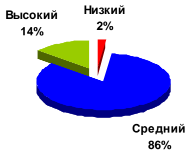
Групппа общеразвивающей направленности