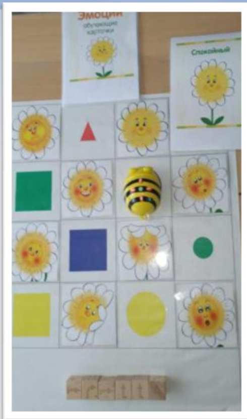
Эмоции – пиктограммы на цветке