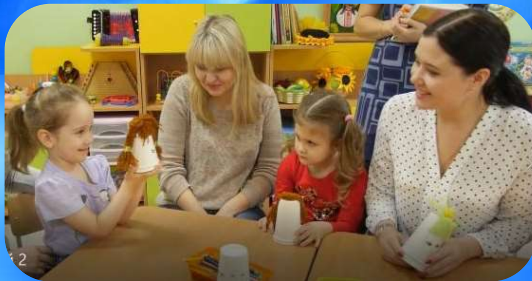
Игрушка с разным настроением